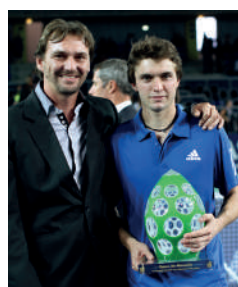
2010 GILLES SIMON