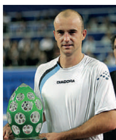
2005 IVAN LJUBICIC