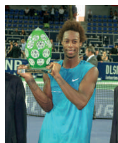
2009 GAËL MONFILS