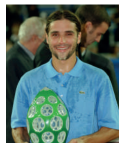
2003 ARNAUD CLEMENT