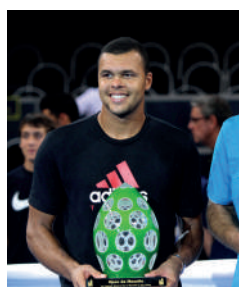
2011 JO-WILFRIED TSONGA