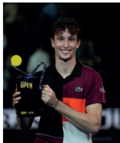
2023 UGO HUMBERT