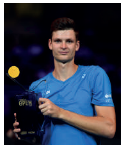
2021 HUBERT HURKACZ