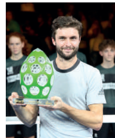
2018 GILLES SIMON