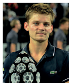
2014 DAVID GOFFIN