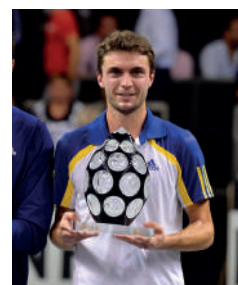
2013 GILLES SIMON