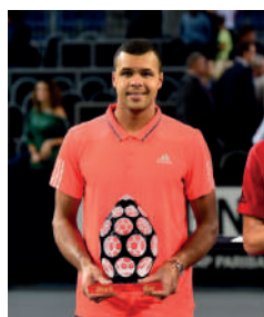
2015 JO-WILFRIED TSONGA