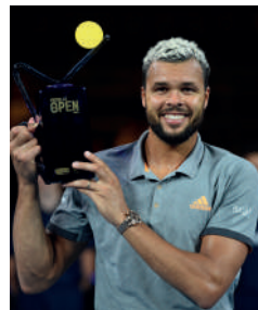
2019 JO-WILFRIED TSONGA