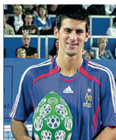
2006 NOVAK DJOKOVIC