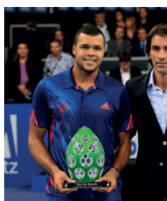
2012 JO-WILFRIED TSONGA